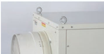
アイボルト 吊り上げ移動ができます。