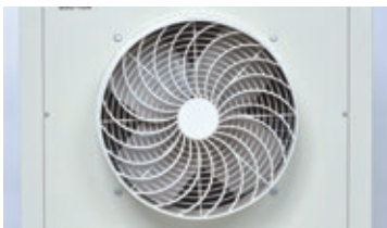
送風口 トルネードガード採用で風の直進性アップ。