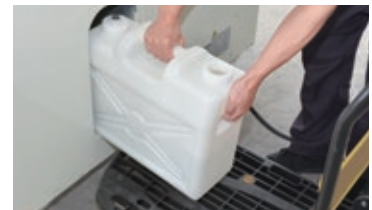
排水口が無い場所でも使用できるドレンタンク式